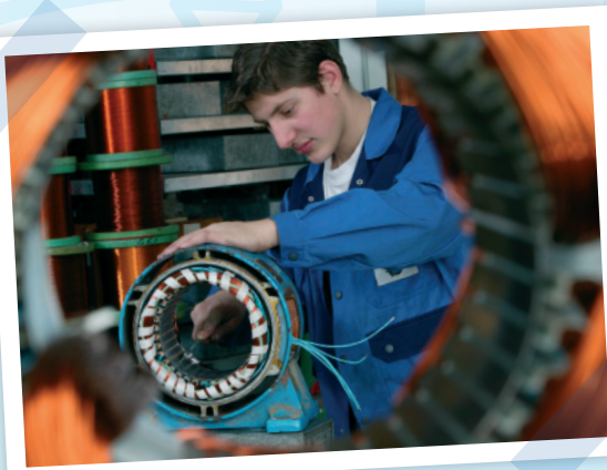
Z. B. Elektronik - Fachrichtung Informations- und Telekommunikationstechnik

Ihr Gesamtüberblick und das Experten-know-how des Technologie-Transfer-Netzwerks des Handwerks (TTnet) bietet Ihnen fast unbegrenzte Möglichkeiten. So können Sie Ihr Vorhaben von allen Seiten betrachten und analysieren. Auf diese Weise sind Sie bestens vorbereitet.