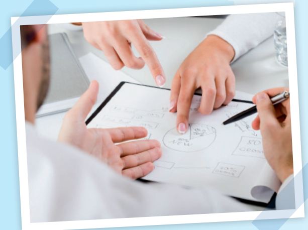
Gute Planung ist Grundlage eines nachhaltigen Erfolgs

Wir haben uns für Sie auf dieses komplexe Thema spezialisiert und stehen Ihnen in allen Fragen gern zur Seite.